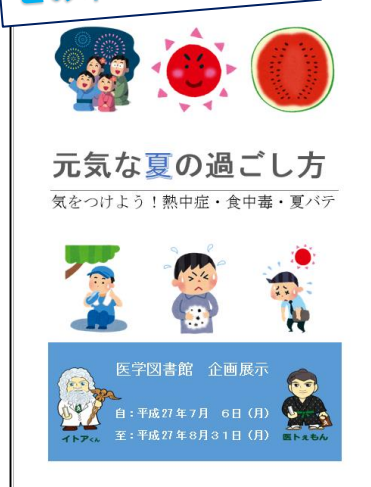
このポスターが目印