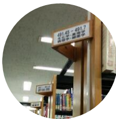
書架の数字を参考に請求記号と合致する資料は…