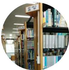
所在の1階閲覧室へ

所蔵場所の1階閲覧室へ向かいましょう。図書館の資料はすべて請求記号順に並んでいます。先ほどメモした請求記号を頼りにたどってみましょう。