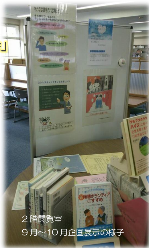
2階閲覧室 9月～10月企画展示の様子