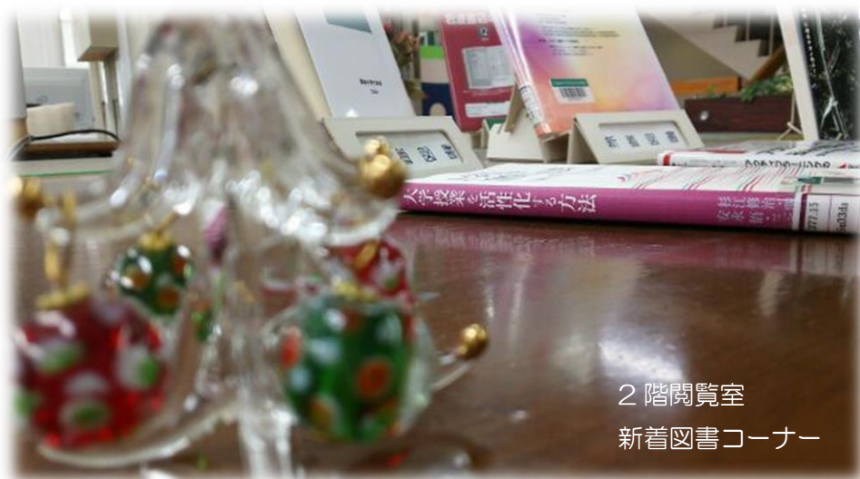
2階閲覧室 新着図書コーナー